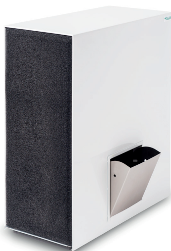
Luftreiniger CC 800 Art.-Nr.: 72000800

ANSAUGSEITE (AUSSENANSCHLUSS), 1 STÜCK PRO LUFTREINIGER