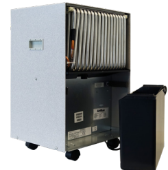
Gerät seitlich mit Behälter