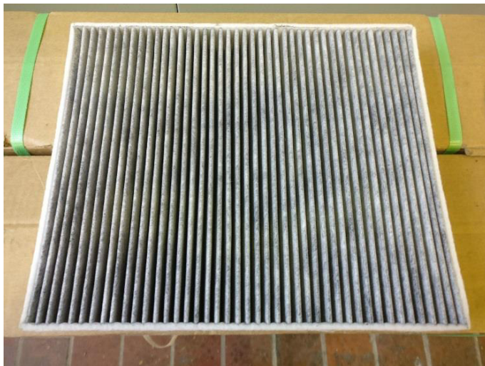
Abbildung 1: Anströmseite des Prüfobjekts

Informationen zu Filterfläche und Filtermaterial liegen nicht vor.