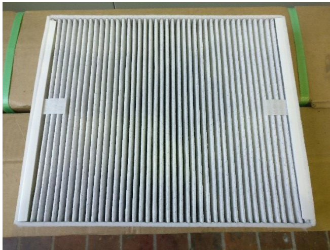
Abbildung 2: Abströmseite des Prüfobjekts